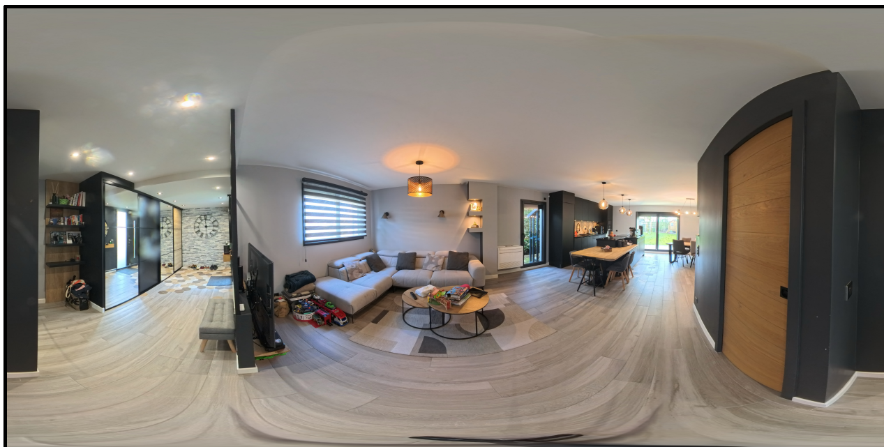
2. (27/03/2025 09:28:01)