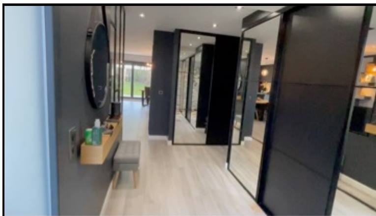
3. Séquence vidéo (01/04/2025 22:11:29)