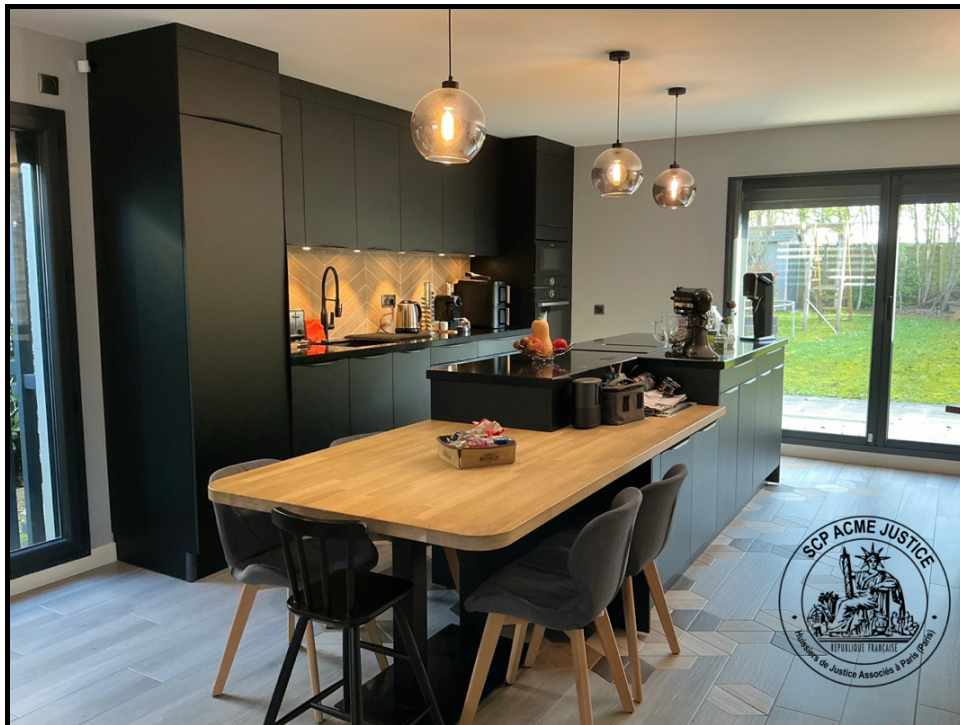
2. (27/03/2025 08:50:55)