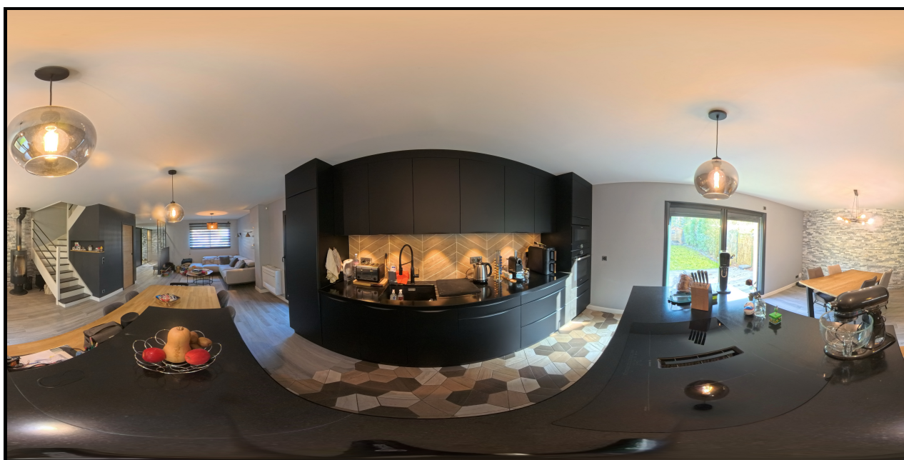
3. (27/03/2025 09:26:49)