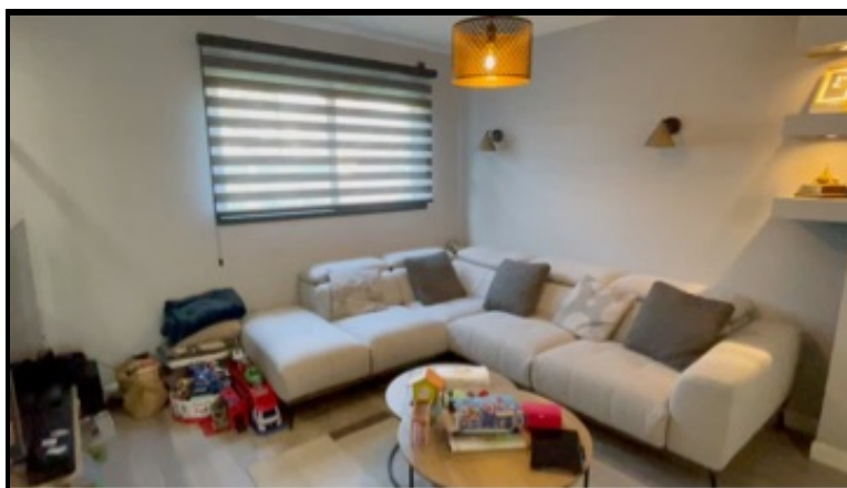
3. Séquence vidéo (01/04/2025 22:13:40)