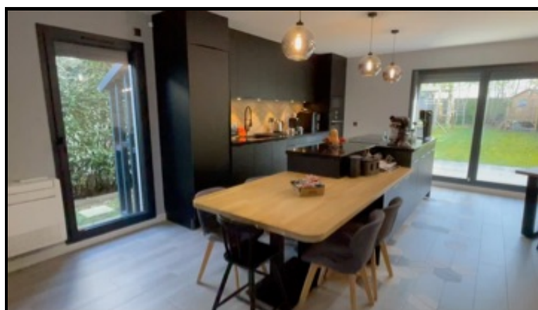
4. Séquence vidéo (01/04/2025 22:14:36)