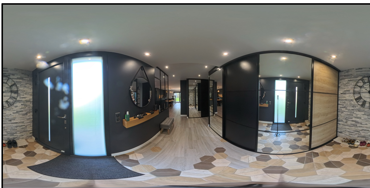
2. (27/03/2025 09:26:44)