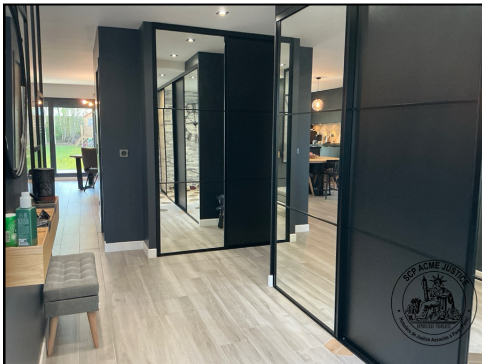
1. (27/03/2025 08:45:55)

Aucun dommage visible, tel que rayures, ébréchures ou traces d'usure, n'est constaté sur les équipements fixes.